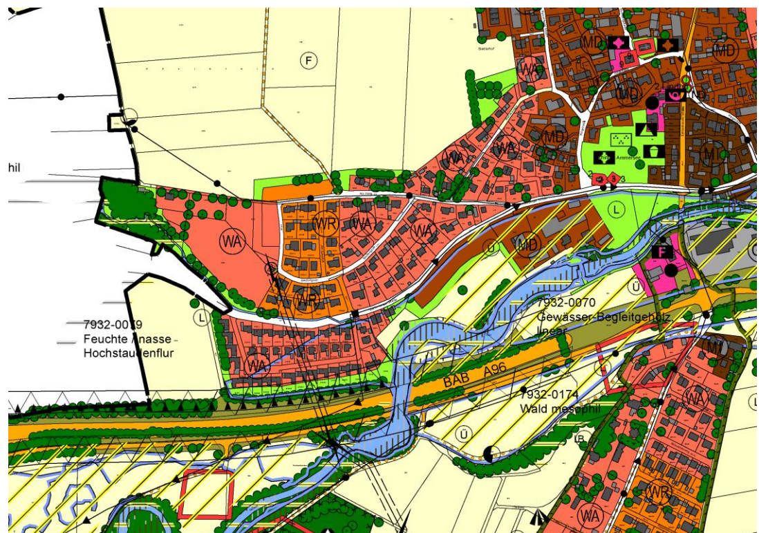
Abb. 1 Ausschnitt aus dem wirksamen FNP ohne Maßstab

Das im Flächennutzungsplan dargestellte Allgemeine Wohngebiet entspricht der geplanten Nutzung, so dass sich der Bebauungsplan gem. § 8 Abs.2 BauGB aus dem rechtskräftigen Flächennutzungsplan entwickelt.